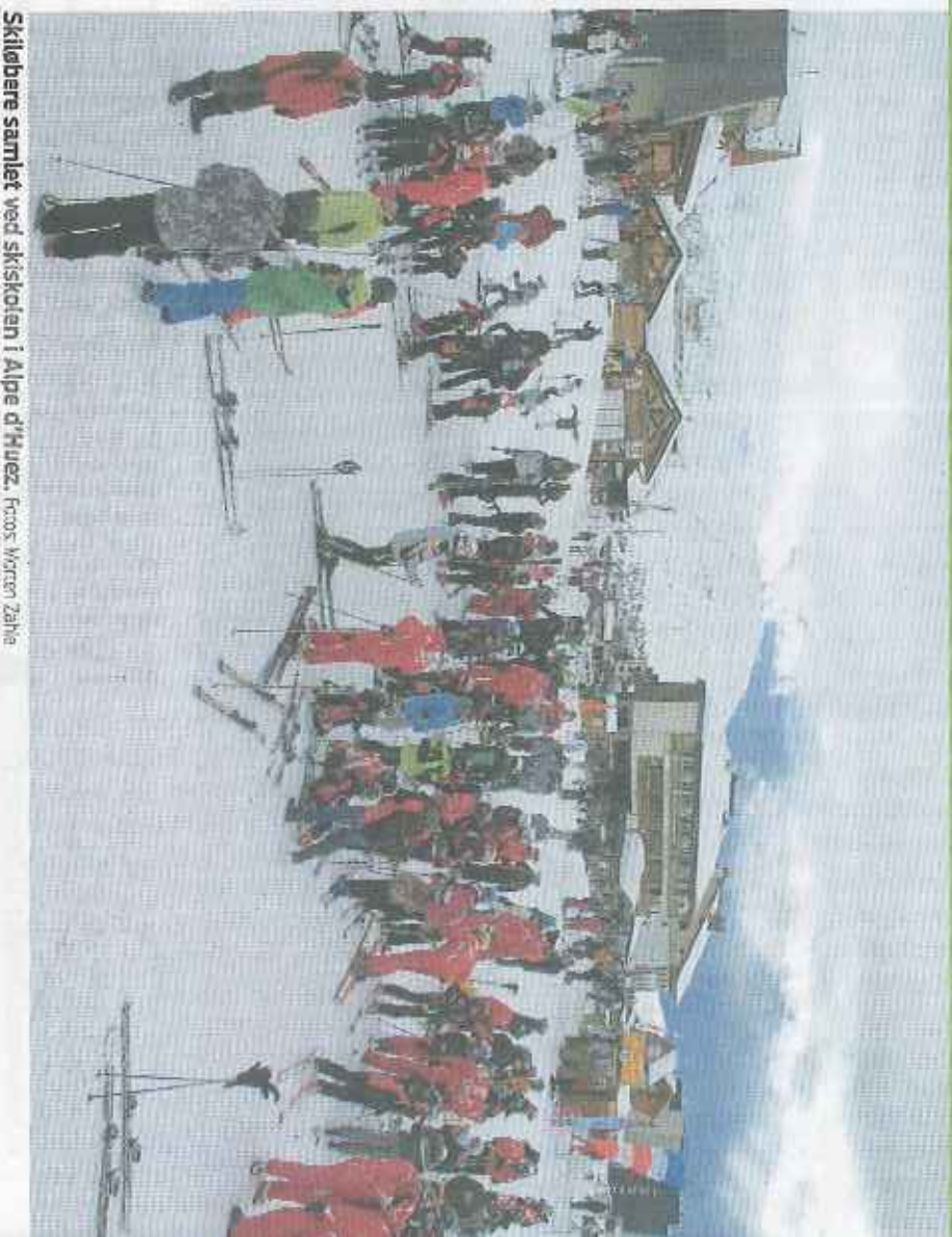
Skiløbere samlet ved skiskolen i Alpe d'Huez.